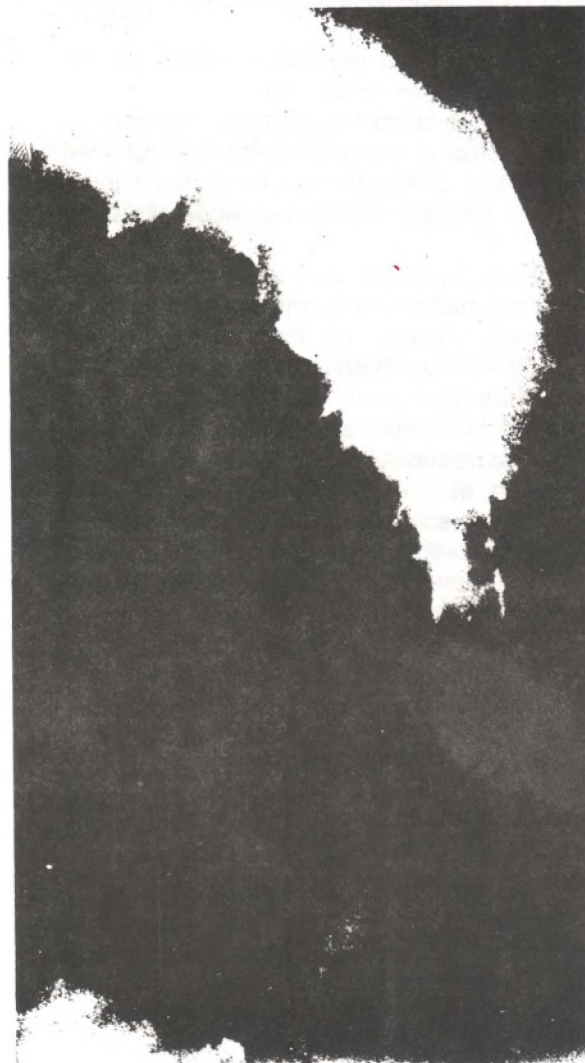
FIGURA No. 3.- MIELOGRAMA DORSOLUMBAR CENTRAL DONDE SE VISUALIZA QUISTE EPIDURAL RECIDIVANTE Y APARECE EL ACÑAMIENTO DE DOS CUERPOS VERTEBRALES CON UNA ANGULACIÓN MAYOR DE 5 GRADOS, COMPATIBLES ESTOS HALLAZGOS CON LA ENFERMEDAD DE SCHEURMANN.

El paciente es intervenido quirúrgicamente, realizándosele laminectomía hasta D8 y D9, con excresis de quiste epidural recidivante,