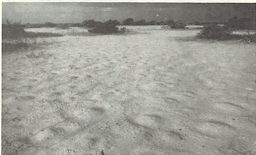
Banco de Reproducción de Flamenco.

Ambas lagunas podrían ser consideradas como áreas potenciales para el establecimiento de Parques Nacionales; la laguna Saladilla como área manejable para el disfrute de la caza deportiva, la pesca y reserva de agua potable para las poblaciones Manzanillo—Pepillo Salcedo, y la laguna Salada de conservación íntegra, que garantizaría la propagación de las aves acuáticas marinas, la conservación del manglar, la fauna cavernícola, el banco de paloma coronita y la foresta seca subtropical con toda su riqueza y en especial la palma Cacheo. Ambas lagunas podrían servir a los estudios biológicos fundamentales que faciliten la mejor comprensión para el desarrollo del país.