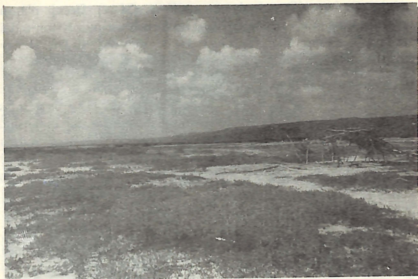
Area llana de suelos salobres donde está situada la Laguna Salada.

Animales silvestres como cerdos y hurones fueron observados, excrementos posiblemente de Plagiodontia aedium fueron colectadas en varios lugares y huellas de un mamífero que podría ser un hurón, que parece que corría en sus dedos, fueron retratadas para una identificación posterior.