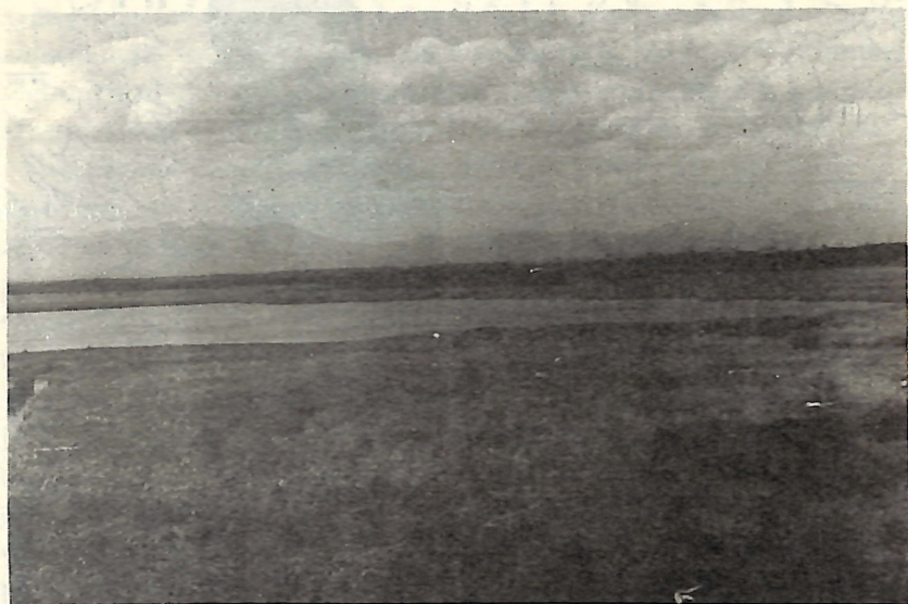
Area del litoral de la laguna con Typha domingensis

las especies más abundantes. Esta vegetación provee directa o indirectamente una gran cantidad de alimento y cubierta para los peces y aves, especialmente las especies acuáticas que allí frecuentan. Ambos tipos de animales pueden desaparecer o al menos reducir sus poblaciones con el mal uso de la laguna.