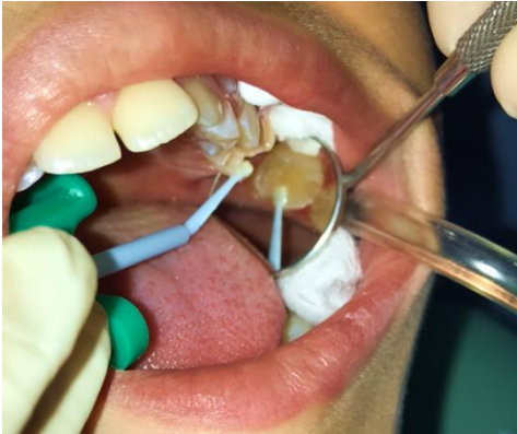
Figura 5. Aplicación del NaOCl al 5,25%.

Se aplicó NaOCl al 5,25% con un microbrush por 60 segundos como se muestra en la Figura 5.