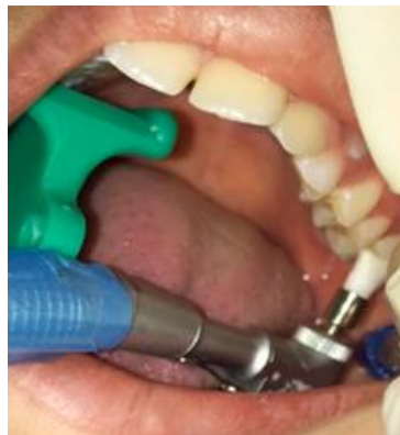
Figura 1. Eliminación de la placa bacteriana.

Se inició con la limpieza de la superficie oclusal de ambos grupos, la finalidad fue eliminar restos de placa bacteriana de la superficie del molar. Esto se realizó con una brocha profiláctica utilizando un micromotor, se lavó y secó con una jeringa triple como se muestra en la Figura 1.