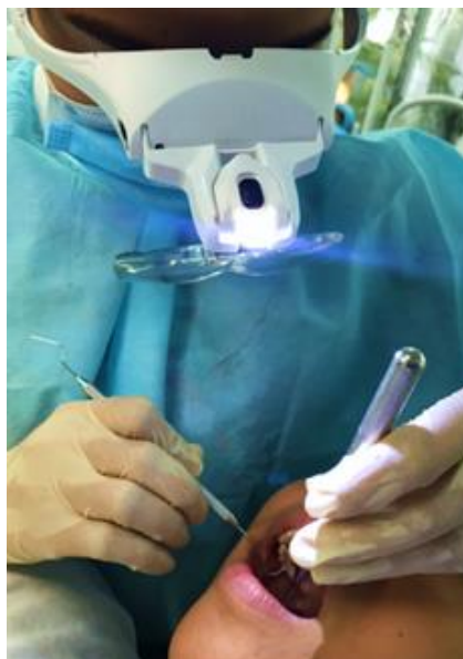
Figura 7. Comprobación de la retención.

A los tres meses se realizó un control, donde se verificó con un explorador y un magnificador la presencia, fractura o ausencia del sellante como se muestra en la Figura 7, según los criterios descritos por Traslaviña et al 4 en su investigación.