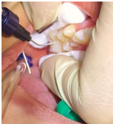
Figura 3. Aplicación del sellante.

Se realizó la aplicación del sellante resinoso sobre las fosas y fisuras de los molares como se muestra en las Figura 3, llevando el sellante directamente del tubo y se realizó vibración con un instrumento (dycalero) como se muestra en la Figura 4.