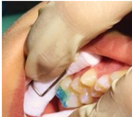
Figura 2. Condicionamiento del esmalte dental.

Se acondicionó el diente con ácido fosfórico al 37% por 15 segundos sobre el esmalte como se muestra en la Figura 2.