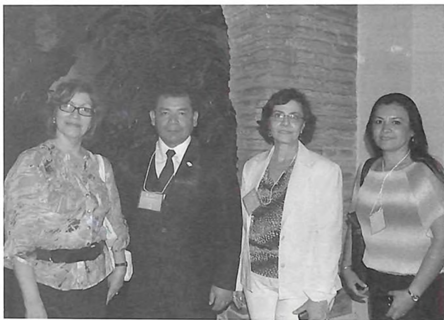
Autoridades de la UNPHU y participantes en el Congreso CITICED.