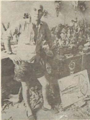
Cita de: “Confusiones de un Artista” por Paul Giudicelli.

En “Mi Columna” hago una reproducción de los conceptos amplios que tenía Giudicelli y que todavía sirven a los jóvenes de brújula para la orientación en un camino difícil de nuestro tiempo donde el joven no tiene una guía adecuada y tiende en ocasiones a desviar el concepto del arte, como comunicación.