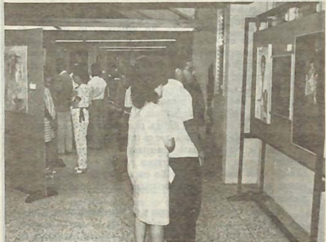
Vista parcial de la Exposición

Cuarenta y cuatro autores expusieron obras en la Colectiva efectuada en la Facultad de Arquitectura, en nueva confirmación de la pujante productividad plástica en nuestro medio, y particularmente en las nuevas generaciones. El conjunto expuesto fue obvia expresión de creatividad inquisitiva y de innegable seriedad artística, puestas ambas al servicio de indiscutibles talentos. Las expresiones estilísticas eran variadas, y fue fácil identificar la existencia de talentos muy prometedores.