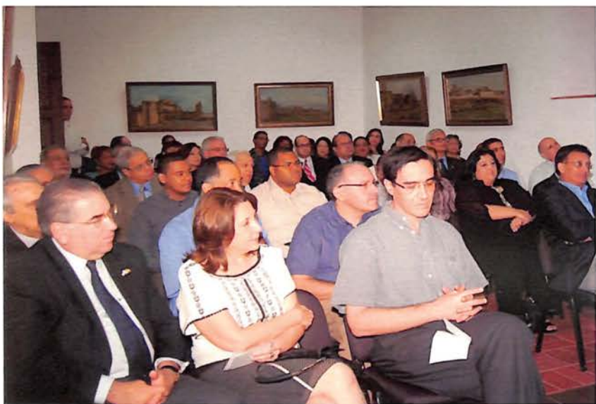
Presentación de la Cátedra Magistral Fray Vicente Rubio.