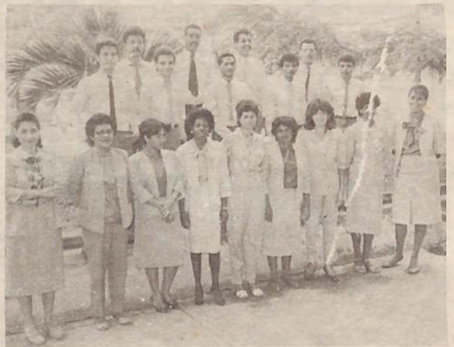
El personal de la Biblioteca UNPHU del Recinto II está estrenando nuevo uniforme. Por tal motivo quisimos ponerlos a "figurear" en las sociales.

Aunque Bethoven haya escrito sus mejores composiciones estando sordo, no significa necesariamente que "llevara la música por dentro".