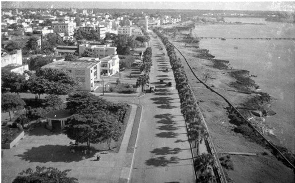
Figura 2. Malecón de Ciudad Trujillo, uno de los espacios más icónicos de la tiranía trujillista.