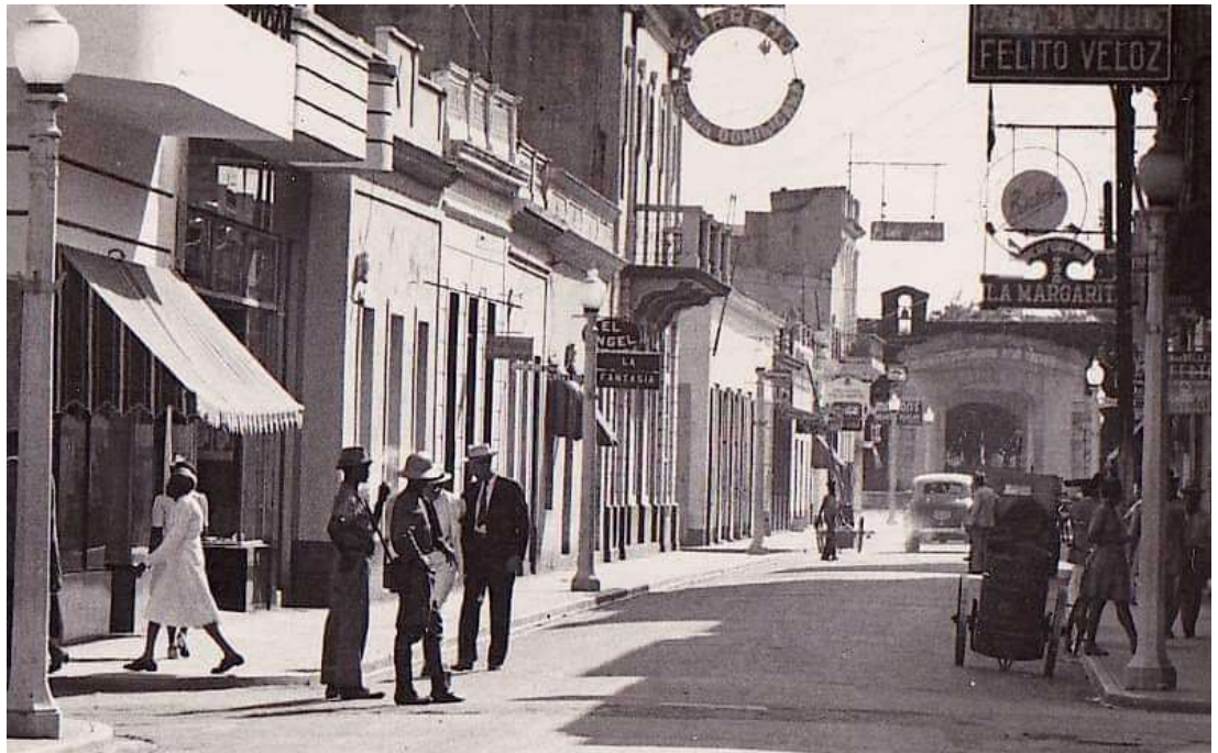
Figura 3. Calle el Conde 1945.

No sólo sería el más icónico de los espacios de la Era de Trujillo, sino que además el malecón sería el ámbito personal de su acción, de su presencia física entre la gente común en la forma de paseos vespertinos donde departía con sus colaboradores. No solía frecuentar de esta manera la ciudad antigua. El Conde, espacio tradicional y calle comercial por excelencia no permitía la distancia requerida por Trujillo para mostrarse. En el Conde la gente le era muy cercana. La condición singular que el discurso mítico le atribuía a Trujillo no toleraba la cercanía (D. Mena, 2000) (figura 3).