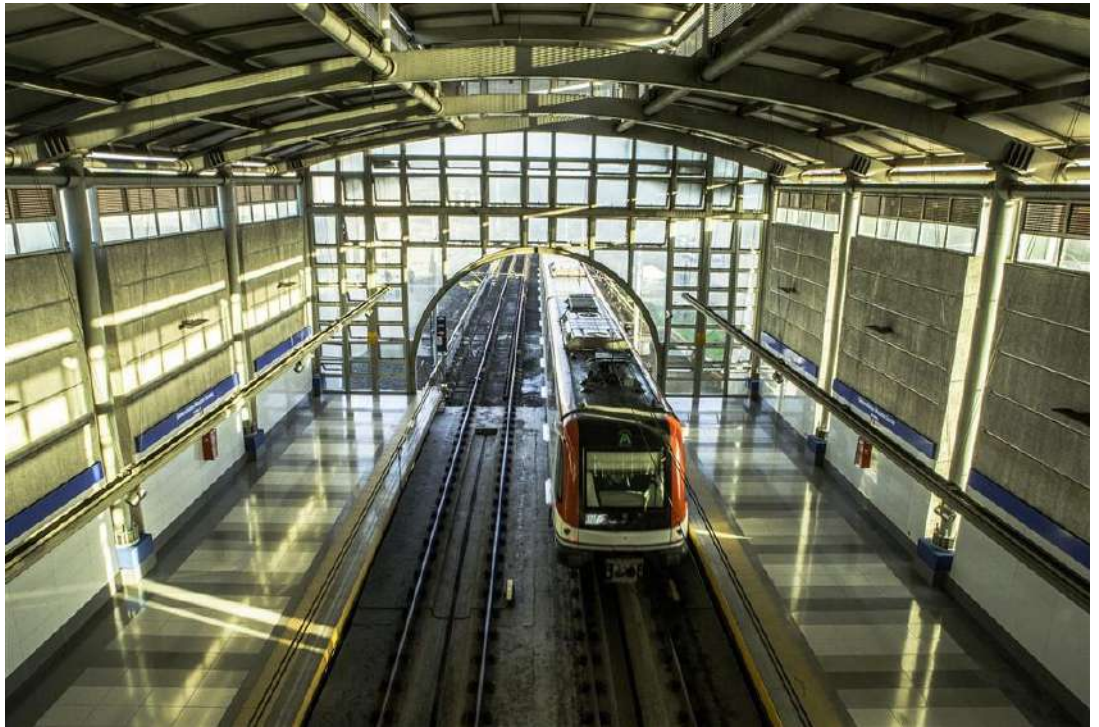
Figura 16. Metro de Santo Domingo.

Santo Domingo, en las primeras dos décadas del siglo XXI se convierte en una ciudad de artefactos de uso, sin símbolos y sin imagen definida. Esta falta de definición resulta problemática en cuanto la ciudad, como espacio de la convivencia humana es un mundo de relaciones espaciales cargadas de significado. Los elementos de la ciudad constituyen un lenguaje que relaciona a las personas (Cela,1992).