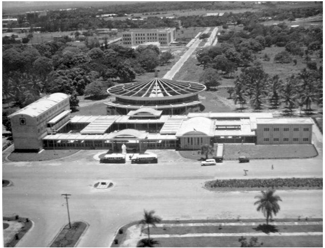
Figura 4. Universidad de Santo Domingo.

En la ciudad trujillista, sin embargo, la arquitectura gozó de un valor meramente icónico sin conformar grandes espacios públicos. Como hemos dicho más arriba, el malecón y solo este aparecería como manifestación de espacios libres. Esto duraría hasta mediados de la década de 1950 cuando se construye la Feria de la Paz y Confraternidad del Mundo Libre (figura 5). Es necesario hacer notar aquí que los espacios abiertos de la modernidad trujillista de alguna manera actuarían como espacios ancilares de la gran avenida marítima, escenario del espectáculo del régimen.