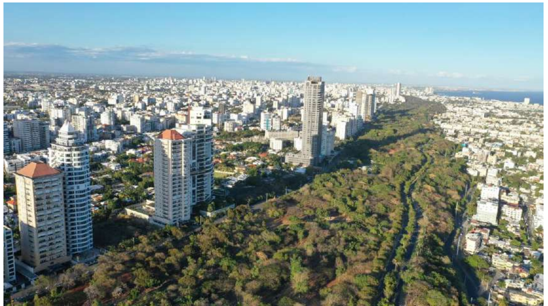
Figura 12. Vista aérea del Parque Mirador Sur, uno de los parques urbanos de los gobiernos de Balaguer.

Balaguer, quien tenía un especial aprecio por la ecología (Diamond, 2005), acogió en su proyecto de ciudad los grandes parques urbanos del plan Solov-Vargas Mera de 1956 y le dio a la ciudad una cualidad paisajística a una escala que no se había conocido antes. El Parque Mirador del Sur (figura 12), el Jardín Botánico, el Zoológico Nacional son producto de este rescate a medias del plan del 56.