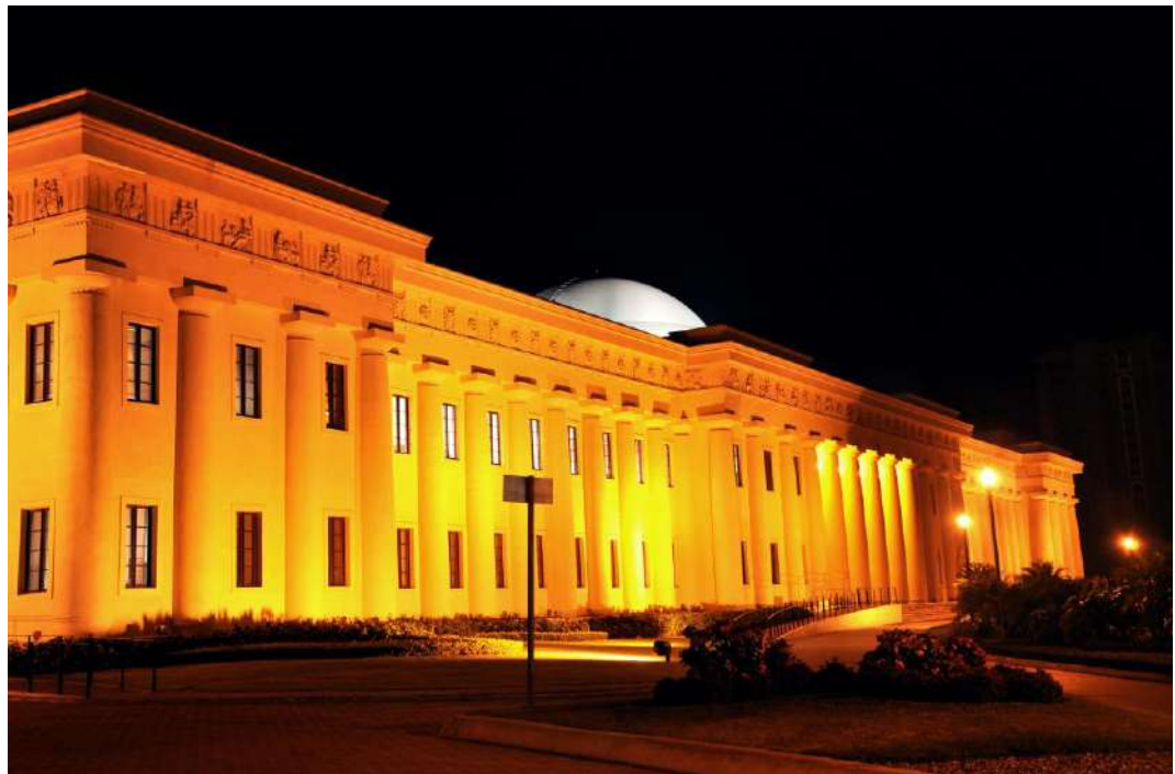
Figura 8. Palacio de Bellas Artes.