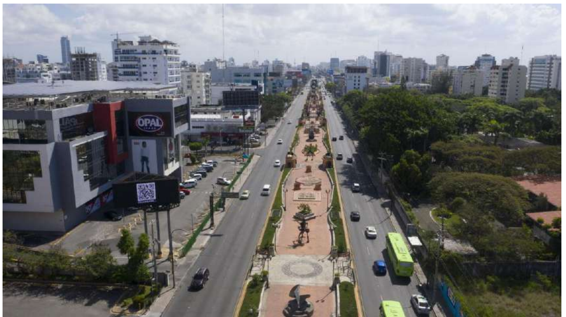
Figura 15. Boulevard de la Av. 27 de Febrero.

Luego de un breve intervalo de tiempo fuera del poder (2000-2004) Fernández retorna con el mismo discurso desarrollista y el programa del Metro de Santo Domingo (Figura 16). De nuevo lo utilitario se impone a lo simbólico y ocupa su lugar. El Metro se convirtió en el “tren de la alegría” como dijera el mismo presidente Fernández en un discurso.