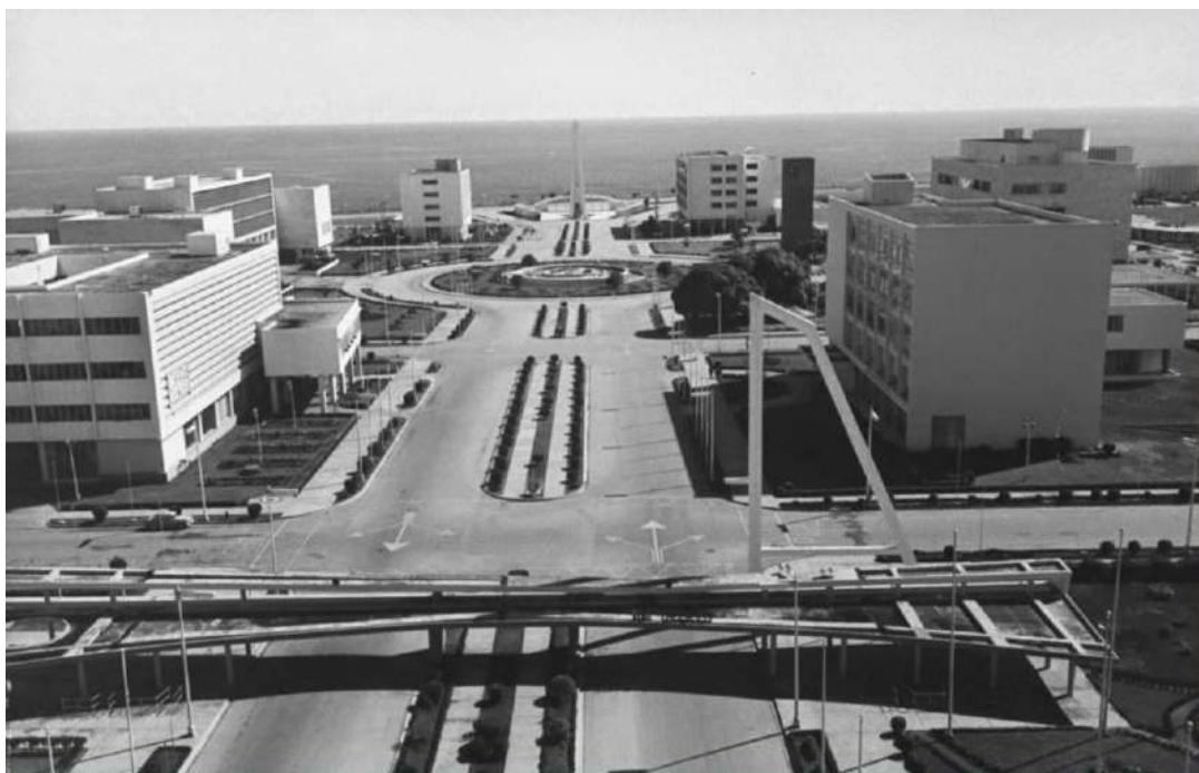
Figura 5. Universidad de Santo Domingo.