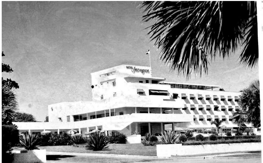
Figura 7. Hotel Jaragua. 1940.

En cuanto a lo icónico, Omar Rancier señala que la arquitectura trujillista nada entre dos aguas. Para los edificios que tienen que ver con salud, educación e industria, así como aquellas instalaciones cercanas a la imagen democrática como los hoteles turísticos el lenguaje será moderno (figura 7 y figura 8). Para las instituciones del estado y el aparato ideológico del régimen se elegirá un neoclásico moderno de corte fascista.