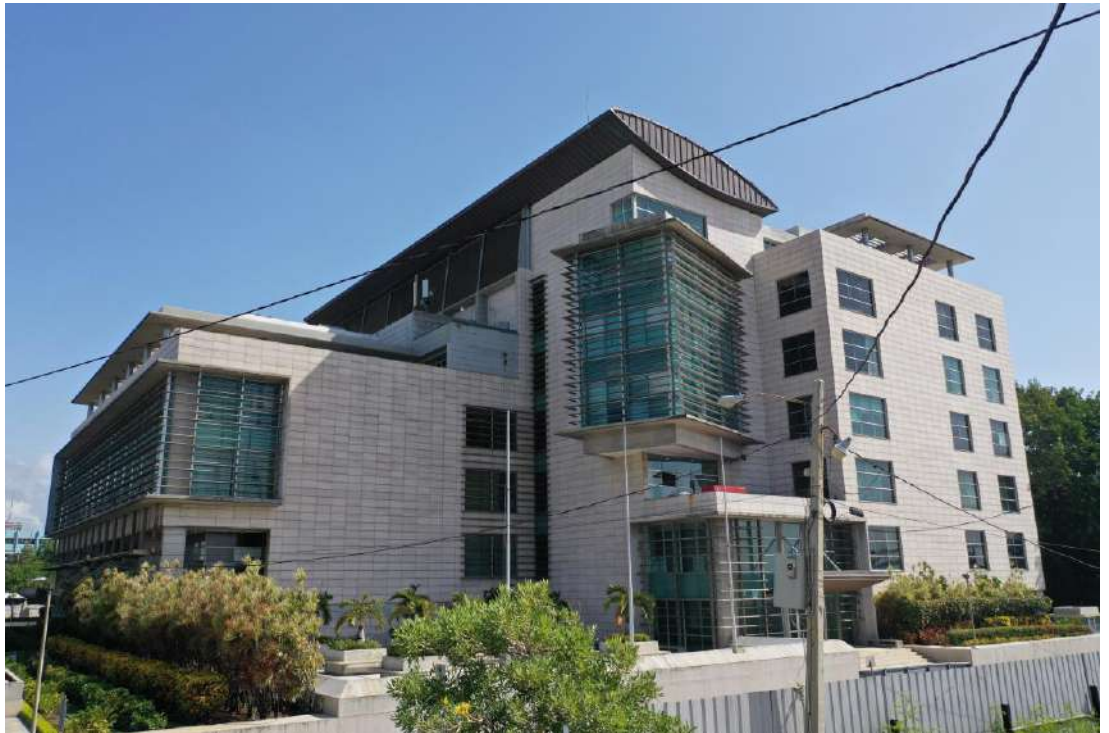
Figura 14. Suprema Corte de Justicia.