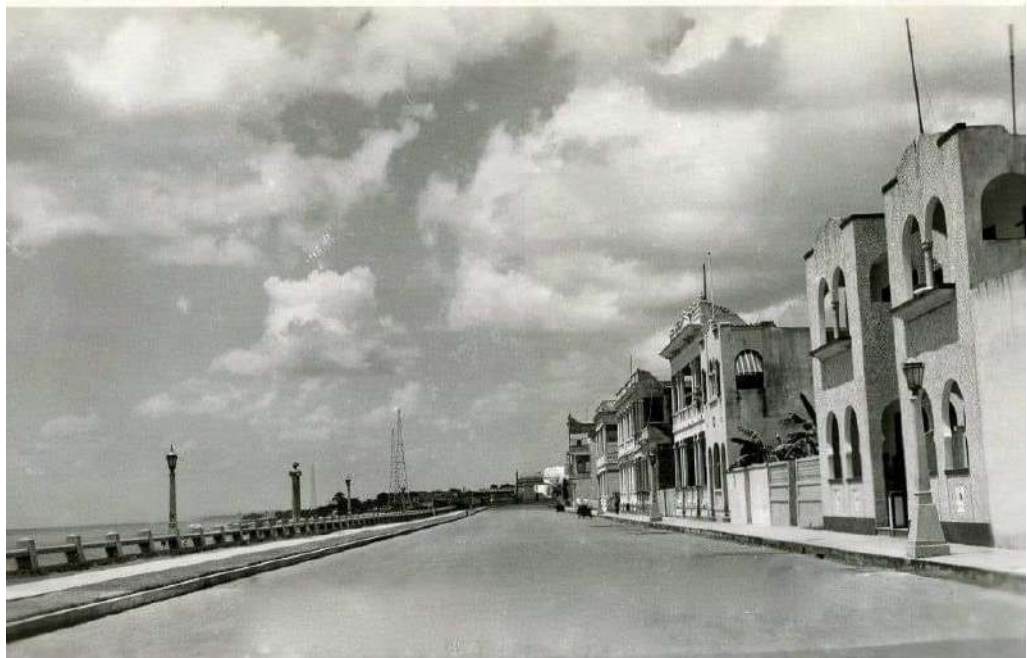
Figura 1. Malecón de Santo Domingo 1937.

obra de Speer y lugar de realización de los congresos del Partido Nacionalsocialista Obrero Alemán (NSDAP), es un espacio lineal, una vía de tránsito; las manifestaciones tendrían forma de desfile. Paradas militares, recibimientos triunfales, desfile de carrozas que mostraban los frutos del progreso trujillista (industria, agricultura, educación), desfile de empleados públicos. Toda la sociedad dominicana, desde todos los puntos de la geografía nacional desfilaría por el malecón bautizado como George Washington en franca adhesión al poder hegemónico de los Estados Unidos.