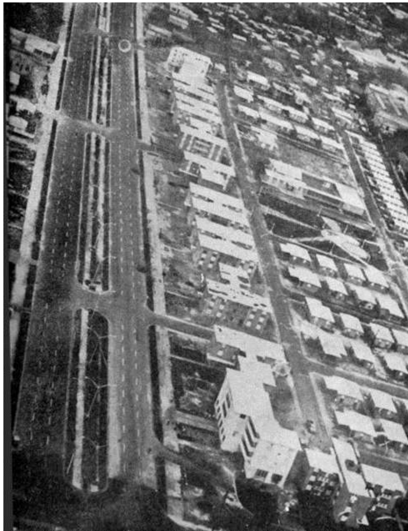
Figura 10. Vista aérea de la urbanización Mata Hambre, inaugurada por el Gobierno de Balaguer en 1967.

La política urbana del régimen balaguerista se enfocó en espacializar los elementos discursivos que caracterizaron a la gestión. En este punto debemos dar una mirada al sistema mítico de Balaguer puesto que al igual que Trujillo, pero sin un cuerpo de intelectuales como el que había poseído el dictador, poseía una serie de mitos que acarrea desde su juventud; como quien dice, guardados para cuando el tiempo le fuera propicio. Entre los mitos del balaguerato podemos citar: el mito del progreso, que sirve como elemento validador del discurso acerca de la industrialización nacional. El progreso incluye también al turismo, representado por la imagen de “la industria sin chimeneas” y a la industria de la construcción, considerada como la actividad que más rápido dinamiza la economía (figura 10). El mito de la herencia hispánica que se manifestará espacialmente en la renovación de la Zona Colonial de Santo Domingo. El sistema mítico balaguerista es mucho más concreto que el de Trujillo, nos circunscribimos a citar aquí los que nos interesan para este trabajo.