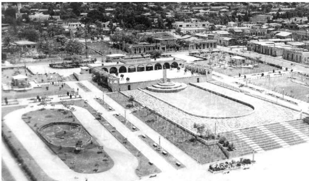
Figura 6. Parque Ranfis.

De igual manera el mito de la patria Nueva se manifiesta en la Feria de la Paz, puesto que estaba llamada a convertirse en el espacio lúdico y sede administrativa que sustituiría a la ciudad colonial. Este centro urbano moderno combina una propuesta arquitectónica de lenguaje contemporáneo con un ordenamiento axial tipo neoclásico (Rancier, 2015). Patria nueva y paz como elementos discursivos del orden trujillista se combinan en este conjunto urbano.