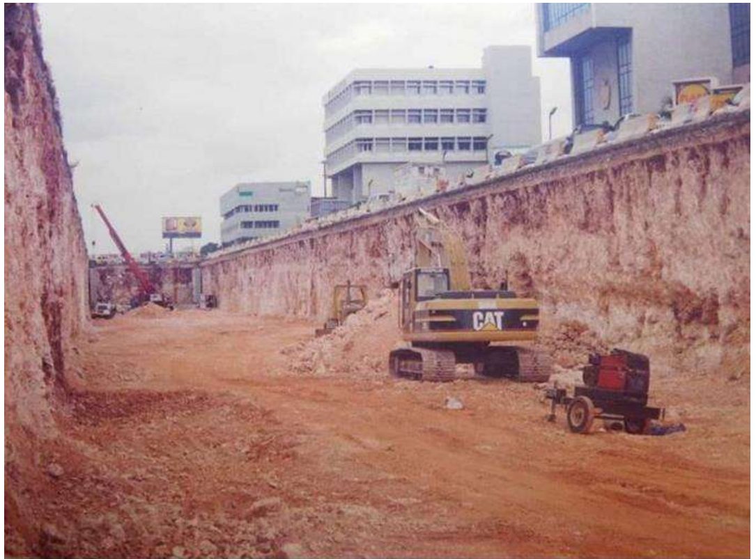
Figura 13. Construcción del túnel de la Av. 27 de febrero, uno de los “megaproyectos” del gobierno de Leonel Fernández 1996-200.

Los “megaproyectos”, nombre con el que se insertaron dentro de la jerga los proyectos viales del periodo responden a una corriente desarrollista que se expandió por América Latina entre 1950 y 1970. Esta corriente sostenía que con la inserción de obras de infraestructura se dinamizaría la economía y se echaría a andar el desarrollo tecnológico de los países de la región.