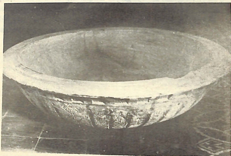
Iglesia de Santa Bárbara, donde Juan Pablo Duarte fue bautizado, y su pila bautismal.