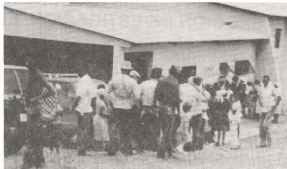
FIGURA No. 2 FOTOGRAFIA DE LA CLINICA ESPERANZA EN YAMASA, PROV MONTEPLATA , R.D.

El 30 de julio de 1960 casó con Nedda Menicucci, su única esposa, con quien lleva 37 años de feliz unión matrimonial y con quien ha