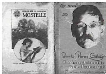
El Crimen de la Calle Fuencarral.