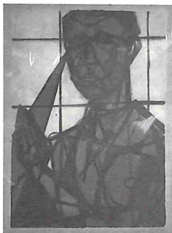
El arquitecto. Obra de Paul Giudicelli dedicada a Eugenio Pérez Montás, 1962.

Todos, en nuestra juventud, hemos estado redactando una novela o una autobiografía secreta. Mientras crecemos, agotamos la trashumancia que nos conduce donde el destino quiera llevarnos. Alternamos episodios simultáneos entre la vida universitaria, hogar del conocimiento y la erudición;