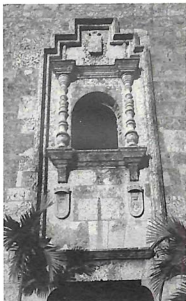
Pórtico Museo Casas Reales.

El segundo documento reflexiona sobre el arte románico con motivo