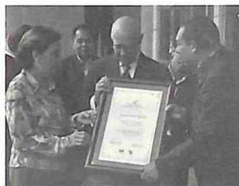
Reconocimiento al autor por el Ministerio de Cultura. 2011.