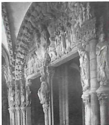
Pórtico de la Gloria (Catedral de Santiago de Compostela).

El cuarto documento es una semblanza de un personaje singular a quien definimos como « un penitente fabricante de nostalgias sentenciado por anarquista y el lenguaje de los colores ». Escrito en el año 2012, describe al