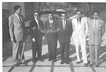
Grupo de dominicanos del Colegio Mayor Nuestra Señora de Guadalupe, Madrid, 1957.