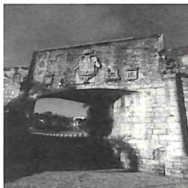
Puerta de San Diego.