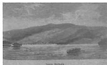
Santa Bárbara de Samaná.