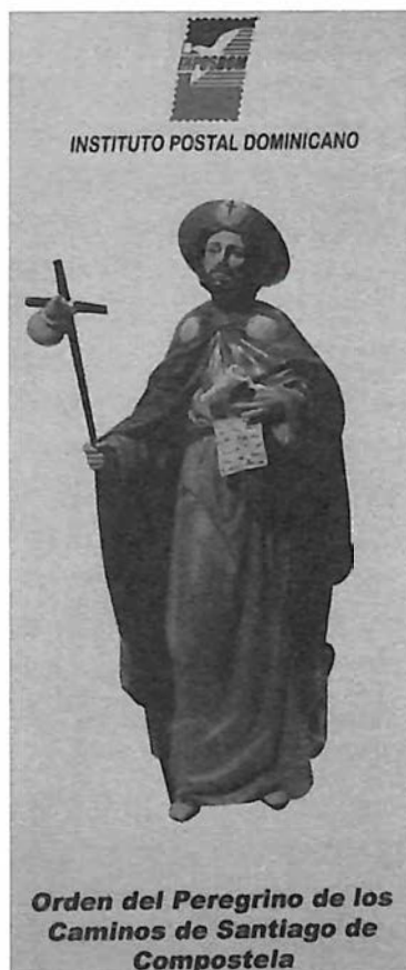
Sello conmemorativo. 2012.