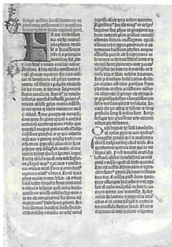
Antiguo Testamento de la Biblia de Gutenberg. ((Fuente: Wikipedia).

La sexta reflexión gira en torno a un libro titulado El Encanto de la Arquitectura : escrito en el año 2010 y que recoge comentarios y recuerdos. Aprovechamos para enarbolar algunos criterios como la falta de aplicación de tecnologías en la restauración de monumentos, que solamente pueden ser manejadas en laboratorios. Uno de estos temas se refiere a la conservación de los materiales, particularmente la piedra, el ladrillo,