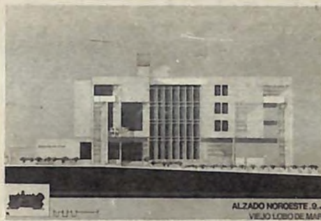
Elevación del anteproyecto "Viejo Lobo de Mar", para el Edificio de la Rosario Dominicana.