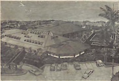
Perspectiva aérea del ante proyecto "Club de Arroyo Hondo".