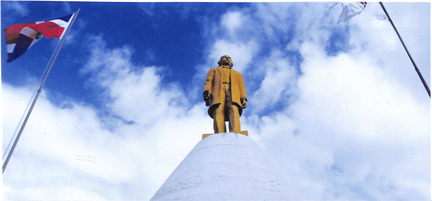
Plazoleta Juan Pablo Duarte