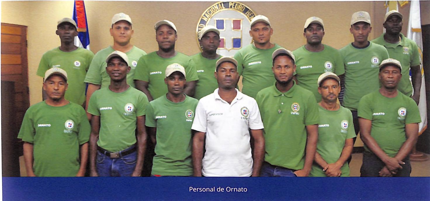
Personal de Ornato