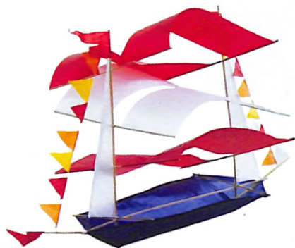
Chichigua de la categoría libre