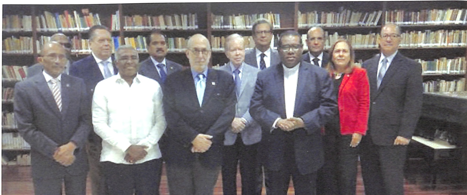
El jurado del Premio Nacional de Literatura durante el anuncio de la ganadora.

El premio Nacional de Literatura 2016 fue otorgado a la escritora Ángela Hernández Núñez, en una conferencia de prensa donde el Rector de la Universidad Nacional Pedro Henríquez Ureña (UNPHU), arquitecto Miguel Fiallo Calderón, participó junto a otros rectores como jurado, organizado por la Fundación Corripio y el Ministerio de Cultura.