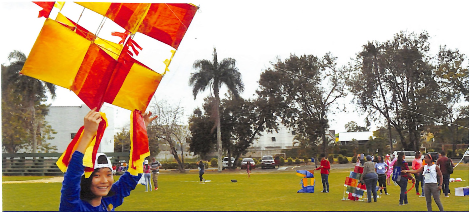
Participante de concurso muestra su creatividad