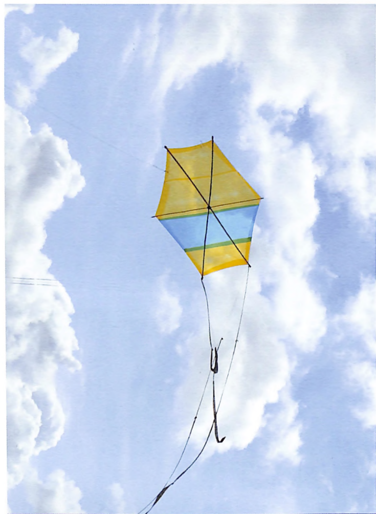
Chichigua de la categoría la más grande