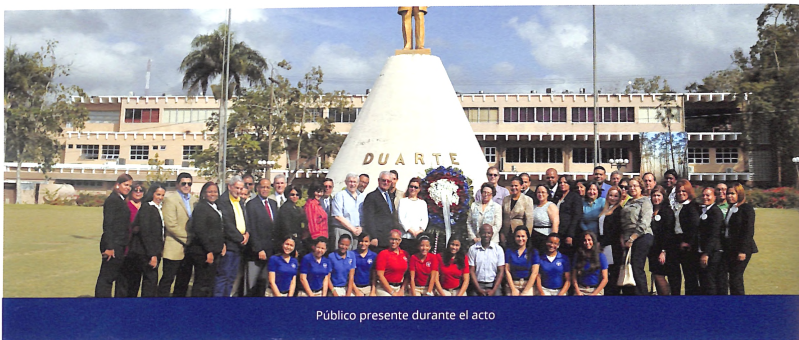
Público presente durante el acto

La Universidad Nacional Pedro Henríquez Ureña (UNPHU) en conmemoración de los 203 años del natalicio de Juan Pablo Duarte, realizó una Ofrenda Floral en la plazoleta del padre de la patria, ubicada frente al Auditorio Horacio Álvarez Saviñón.