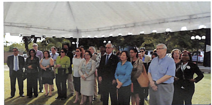
Autoridades presentes en el acto de conmemoración del Bicentenario del Natalicio de Juan Pablo Duarte.