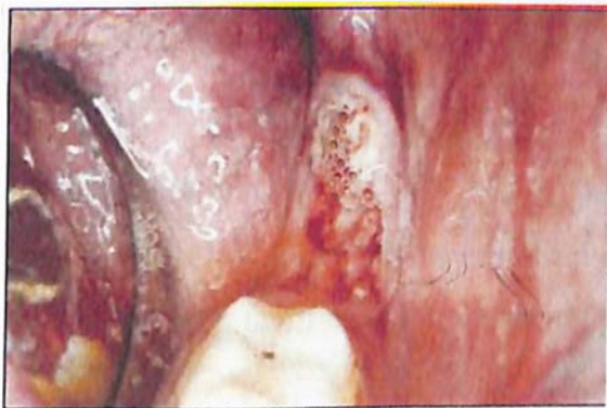
Figura 6. Carcinoma epidermoide en glándulas salivales 38 .