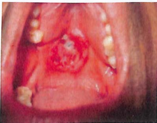
Figura 5. Carcinoma epidermoide, paladar 36 .

Paladar: la aparición del Carcinoma epidermoide del paladar es de los menos frecuentes, siendo el más frecuente el adenocarcinoma 19 .