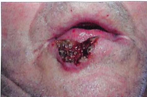
Figura 1. Carcinoma del labio 32 .

Labio: el carcinoma de células escamosas del labio, es la neoplasia carcinomatosa presente en mayor medida en la cavidad oral, y en la raza blanca. Dentro de este tipo de carcinoma, el labio inferior es el más comúnmente afectado en relación al labio superior, esto debido posiblemente a la exposición más directa a los rayos ultravioleta de la luz solar 31 .