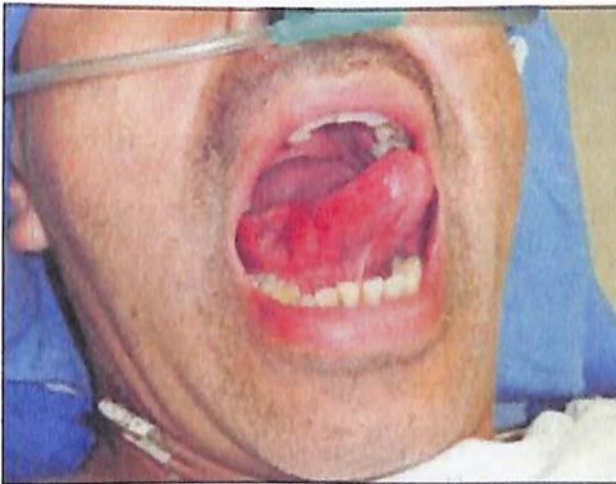
Figura 2. Carcinoma epidermoide en la parte lateral de la lengua 33 .

Piso de boca: se presenta casi siempre en personas de edad mediana o avanzada. Es muy agresivo localmente. Esto dificulta establecer el sitio de origen cuando se detecta en fase avanzada, incluso puede comprometer la musculatura de la lengua, provocando inmovilidad y dificultad para hablar. Su metástasi es rápida y casi siempre se detecta al momento del diagnóstico. Como todos los cánceres de la mucosa oral, es asintomático en sus primeras etapas. Es precedido por lesiones leucoplásicas, eritroplásicas o una combinación de ambas, que empieza a crecer, se endurece hasta convertirse en una úlcera. 19