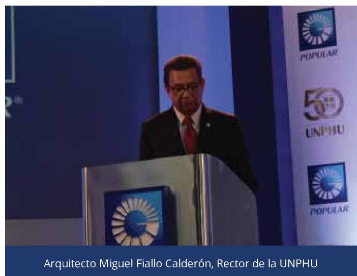
Arquitecto Miguel Fiallo Calderón, Rector de la UNPHU