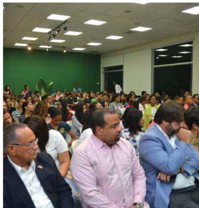
Público en general.