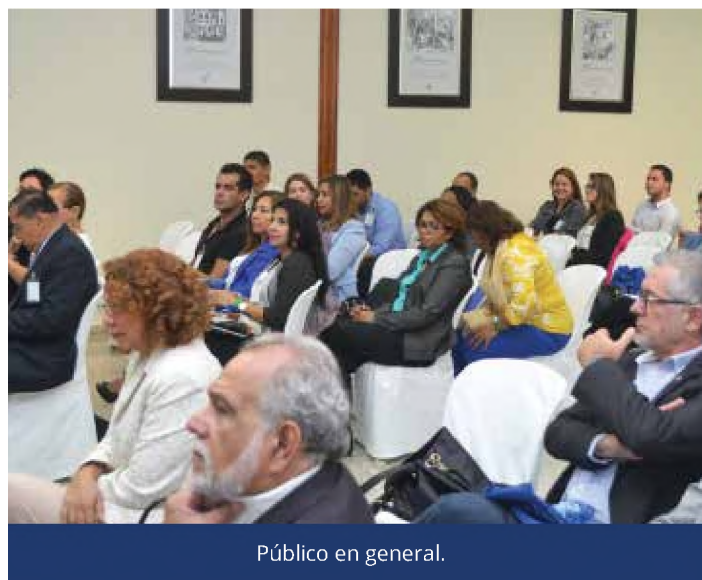
Público en general.