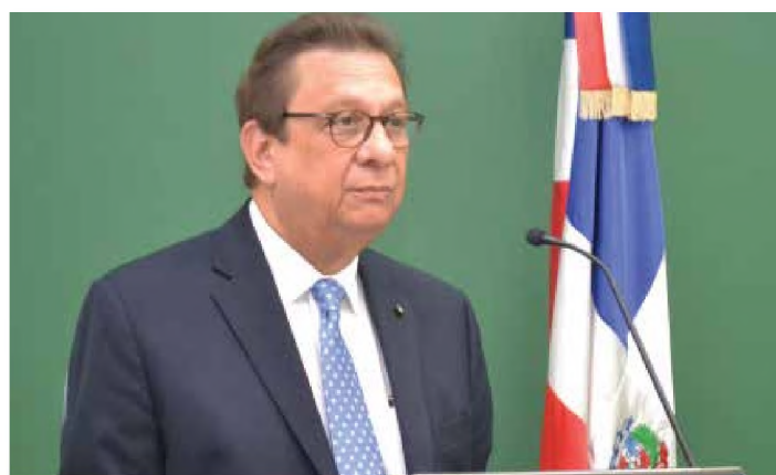
Arquitecto Miguel Fiallo Calderón, Rector de la UNPHU

El evento permitió la discusión de temas y las posibilidades de intercambio sobre las diferentes temáticas abordadas tales como la educación a distancia y los ambientes virtuales de aprendizaje, la universidad en la sociedad de la información y el conocimiento, La formación de competencias, las TIC y sus aplicaciones en la educación, situación actual y