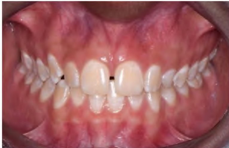
Figura 2. Imagen oral de manifestación del grado moderado de fluorosis dental.