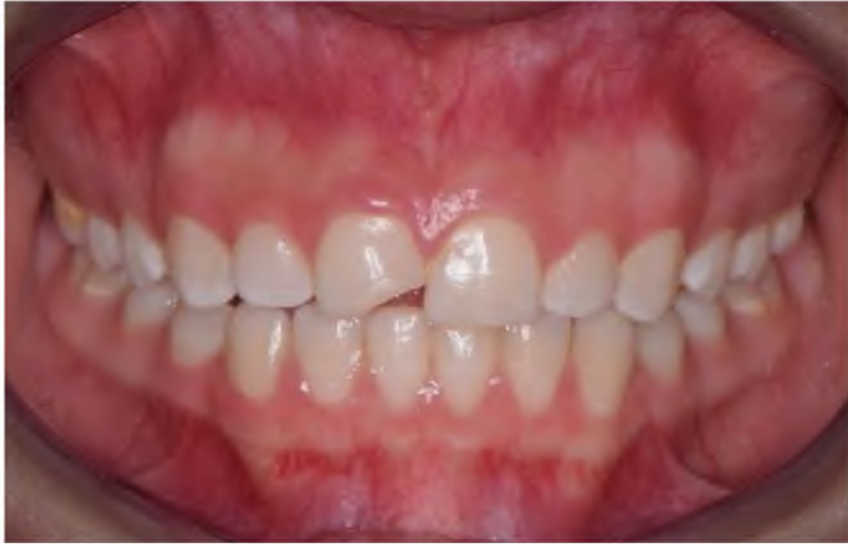
Figura 1. Imagen oral de manifestación del grado leve de fluorosis dental.