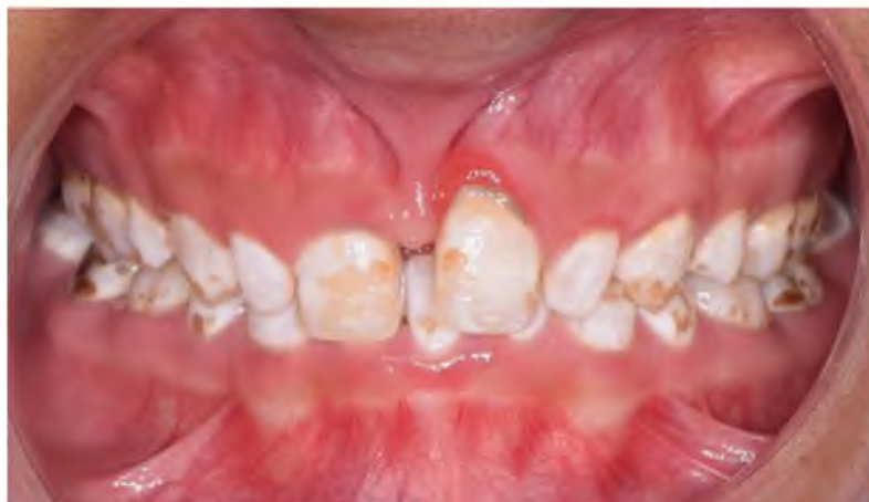
Figura 3. Imagen oral de manifestación del grado severo de fluorosis dental.