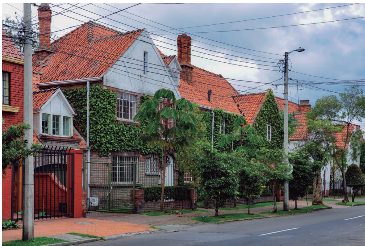
Imagen 5. Barrio La Magdalena, Bogotá. Declarado bien de interés urbanístico y arquitectónico.

lo contradictorio, para dar cuenta de unas lógicas que operan como expresión de unos fenómenos que introducen la variable de lo temporal como un hecho para ser considerado con mayor atención. En primera instancia se puede mencionar lo informal como un hecho característico de las ciudades latinoamericanas, donde los espacios de tiempo en la ocupación, lo esporádico y lo no localizado, aparece ligado a diversas actividades comerciales. Los barrios declarados no escapan a esa condición. En ellos lo informal modifica, altera o se integra con las relaciones de la comunidad propiciando unas prácticas cotidianas que generalmente tienden a ignorarse cuando se analizan estos sectores. Por principio, cualquier intervención sobre el espacio público, sean andenes, avenidas, parques o corredores viales de transporte masivo, apuntan a desaparecer ese tipo de actividad generada por la invasión de lo informal. Lo informal en este caso se asocia a «lo popular» que