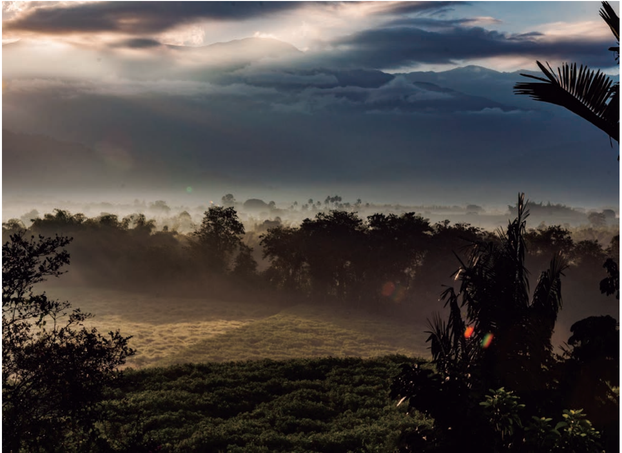
Imagen 1. Amanecer en el paisaje cultural cafetero en Colombia. Declarado patrimonio de la humanidad por la Unesco.

para compartir aficiones comunes; en el espacio público con una relación ambivalente donde la interacción social que pretende construir ciudadanía, promoviendo valores y comportamientos basados en el respeto y la convivencia, se enfrenta en muchos casos con lo amenazante y peligroso de algunos lugares públicos; en convocatorias hechas por las redes sociales para realizar protestas, acciones sociales o celebraciones. También para responder a requerimientos de carácter oficial donde se necesita de la participación ciudadana con fines políticos. Lo imprevisible se manifiesta igualmente interviniendo el patrimonio en algunos sectores declarados de interés patrimonial con unos resultados que son de difícil interpretación y con un efecto inmediato en el paisaje urbano. Esta situación pone de manifiesto la necesidad de contar con