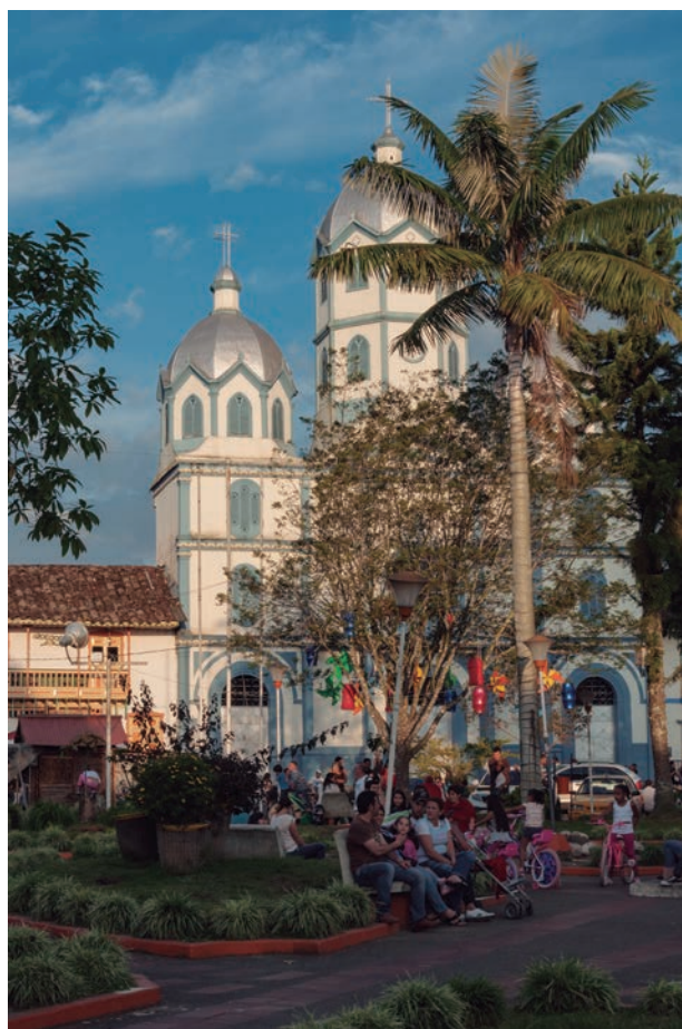
Imagen 2. Parque principal de Filandia, Quindío. Colombia. Pueblo que hace parte del paisaje cultural cafetero declarado patrimonio de la humanidad por la Unesco.

En el caso colombiano existen algunos instrumentos para intervenir los sitios patrimoniales o de interés cultural que se encuentran articulados dentro de los Planes de Ordenamiento Territorial y de los Planes Estratégicos de Desarrollo. Los Planes Especiales de Manejo y Protección PEMP permiten estructurar acciones específicas que apuntan a re-funcionalizar los lugares patrimoniales en el marco de las políticas públicas y los planes de desarrollo, tanto a nivel local como nacional. Sin embargo, algunos componentes de estos planes no parecieran comprender la realidad de la vida actual dentro de la situación específica de una comunidad con unos intereses que ya no se encuentran en la tradición sino bajo la presión del mundo globalizado. ¿Cuál es el interés real de las nuevas generaciones? 7 ¿En qué