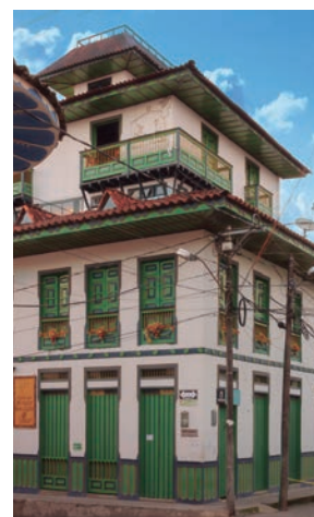
Imagen 4. Arquitectura que imita las construcciones tradicionales en Filandia, Quindío.