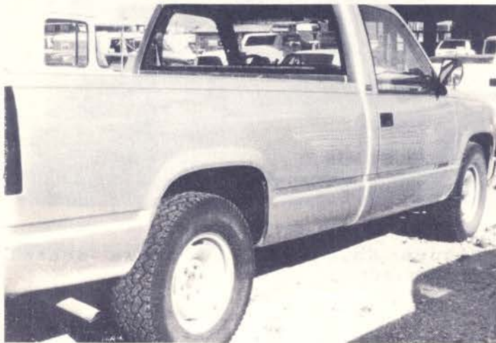
Foto No. 1. Vista lateral de la camioneta del chofer que se declaró culpable de haber atropellado y matado un hombre.

Se trata del caso de un hombre de origen hispano de 57 años de edad que se vió envuelto en un accidente mientras manejaba su camioneta (Foto no. 1).