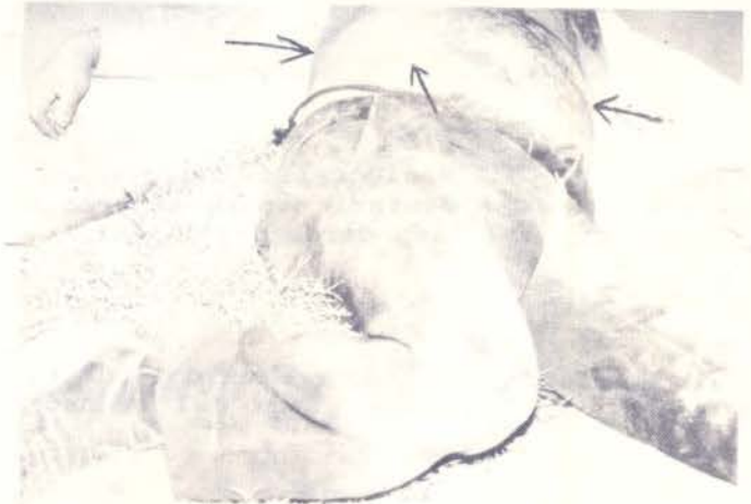
Foto No. 2. Foto tomada por la policía en el sitio del accidente donde se aprecia marcas de polvo de las gomas de un vehículo de motor cruzando el abdomen a nivel del ombligo (flechas). No hay señales de sangrado en esta zona.

La autopsia mostró fracturas múltiples en las costillas, el esternón, la