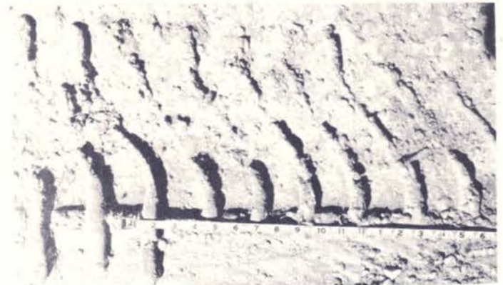
Foto No. 5. Huellas en el lodo de las gomas del camión grande.

Las marcas en el lodo de las gomas del camión grande (Foto No. 5), coincidían con las del pecho de la víctima casi exactamente.