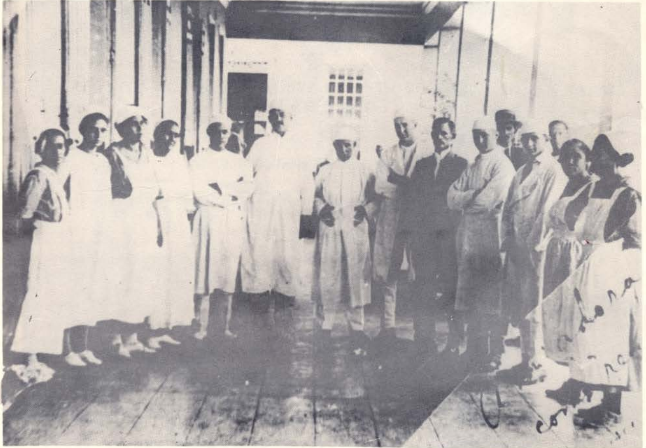
PERSONAL DEL HOSPITAL SAN RAFAEL EN 1926