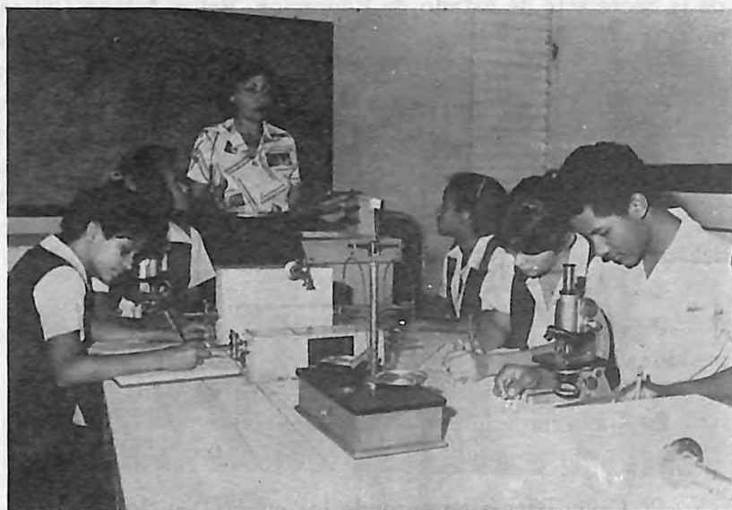
Estudiantes de Biología en una sección de laboratorio.

El Liceo de Prácticas y Experimental UNPHU es una escuela de Educación Media, fundada por la Universidad Nacional Pedro Henríquez Ureña, en el año 1967. Está situada al fondo del Campus I