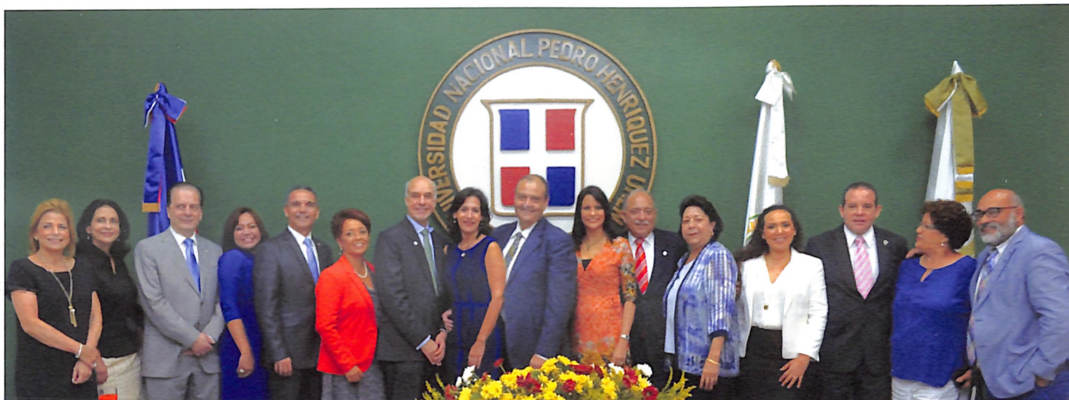
Autoridades académicas de la UNPHU junto a Egresados de Medicina