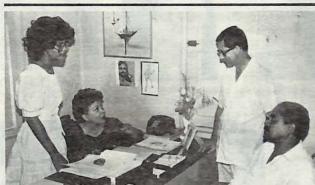
Personal del Centro de Orientación

La oficina de Registro y Evaluaciones está situada en el Campus I, edificio central, primera planta. Sus horas de trabajo, de lunes a viernes, son: de 8 a 12 en la mañana y de 1 a 5 en la tarde