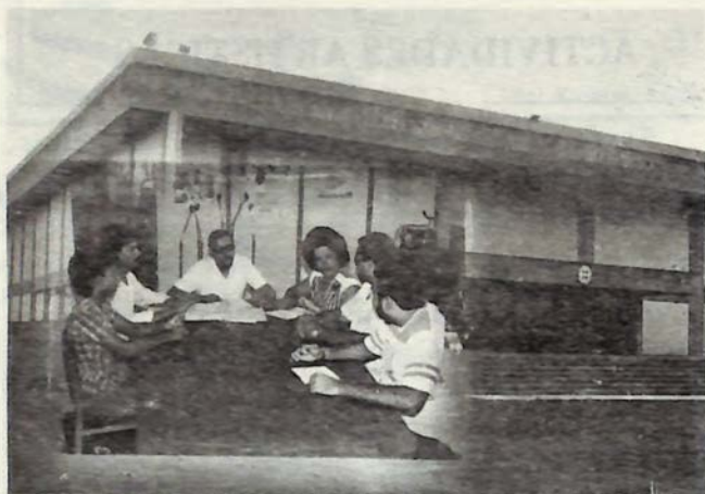
Personal del Departamento de Actividades Artísticas

El departamento de Actividades Artísticas es uno de los más activos de nuestra universidad, se inició el 1ro de septiembre del año 1982 ofreciendo a nuestros empleados y estudiantes la oportunidad de participar en los siguientes grupos: