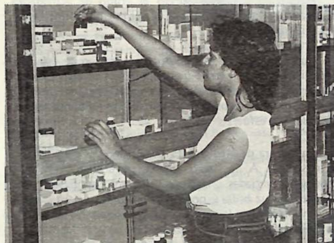
Personal de la Farmacia Modelo UNPHU

Esta Unidad constituida por profesionales del área, ofrece en los dos Campus, servicios gratuitos de atención médica básica a todos los empleados, profesores y estudiantes de la Universidad. Esta Unidad ofrece también servicios de vacunación.