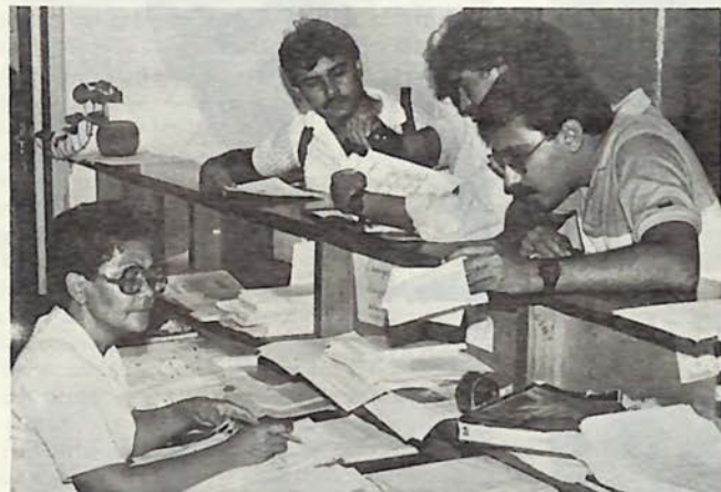
Parte del Personal del Departamento de Registro