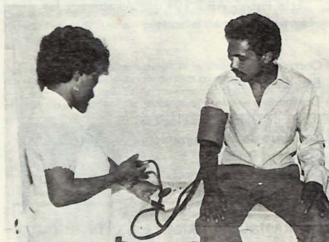
Departamento de Servicios Médicos para los Estudiantes y empleados

Ajedrez arco y flecha, atletismo, baloncesto, beisbol, futbol, natación, tennis de campo, tennis de mesa, voleibol, y judo.