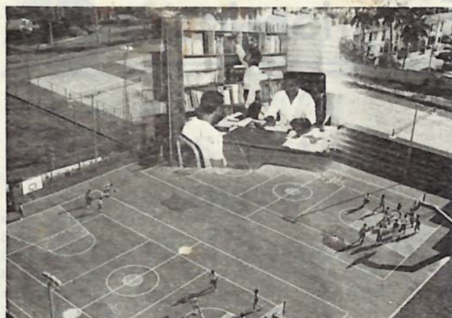
Personal Departamento de Educación Física y Deportes