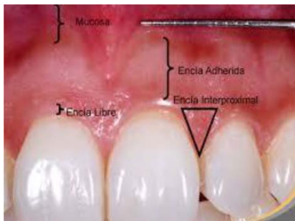
Fig. 1. Representación de la encía. 19

La misma se encuentra localizada en el nicho interproximal, llenando todo el espacio, presenta forma piramidal en la zona anterior y depende de la forma y alineación de los dientes en la arcada. A nivel posterior, existen dos papilas una vestibular y una lingual/palatino las cuales están unidas por una depresión cóncava que rodea el área o relación de contacto y que recibe el nombre de “col”. Histológicamente hablando, el col está formado por un epitelio no queratinizado que hace que esa zona de la papila sea susceptible a la penetración de los productos tóxicos de los microorganismos, lo que provoca inflamación gingival. De allí la importancia de prestar gran atención en esta área al momento de realizar restauraciones ya que es uno de los tejidos más afectados por las mismas y para que a su vez, la misma pueda cumplir con sus funciones. 14