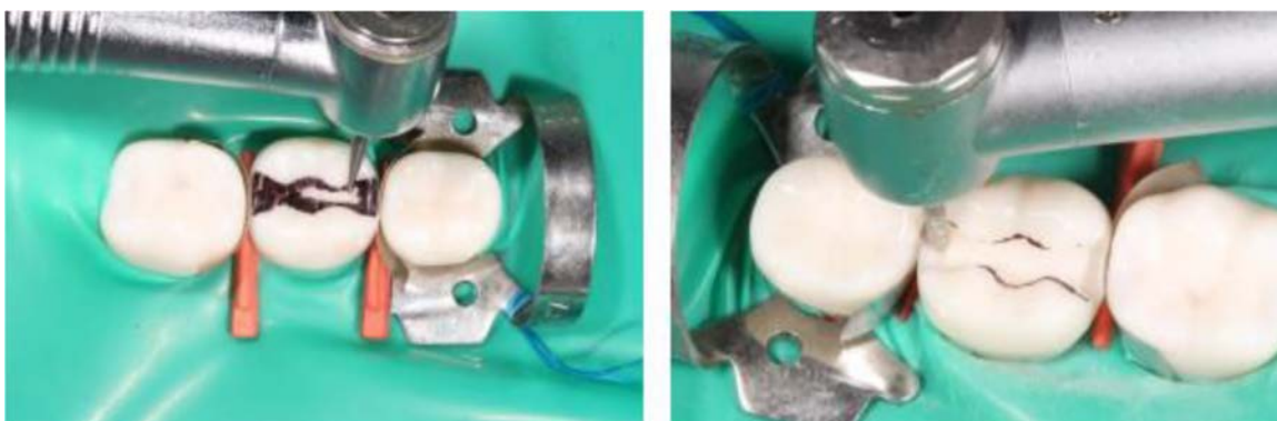
Fig. 5. Preparación cavitaria Clase II – Cavity MOD – Con cajas proximales piriformes. 27

Las lesiones del tercio cervical o clase V son aquellas que se forman en el tercio gingival o cervical de las superficies vestibulares, linguales o palatinas de todos los dientes, una vez que estos se han visto afectados por procesos patológicos tales como: caries dental, abrasión, erosión y/o abfracción. 28