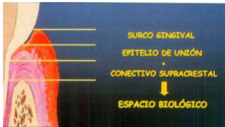
Fig. 2. Representación del tejido gingival supracrestal. 2

El tejido conectivo supracrestal está conformado por un (5%) de fibroblastos; células de los vasos sanguíneos, linfáticos, terminaciones nerviosas y matriz representan (35%) y fibras colágenas tipo uno (60%), las cuales van a estar distribuidas en haces denominadas: grupo gingivodental, periostio dental, circular, alveolo gingival y transeptales.