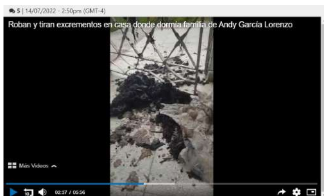
Fuente: Captura de pantalla del video publicado por Roxana García. Foto © Facebook / Roxana García Lorenzo. 14 julio 2022.