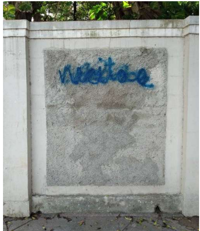
Imagen 5, 6 y 7. Graffitis en la calle Línea, Vedado, La Habana