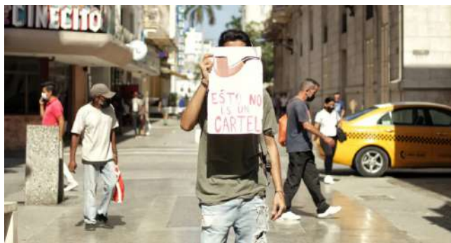
Fuente: Foto de María Lucía Expósito tomada del texto escrito por Romero, “Escucha tu nombre”, La Joven Cuba, 12 abril 2022.